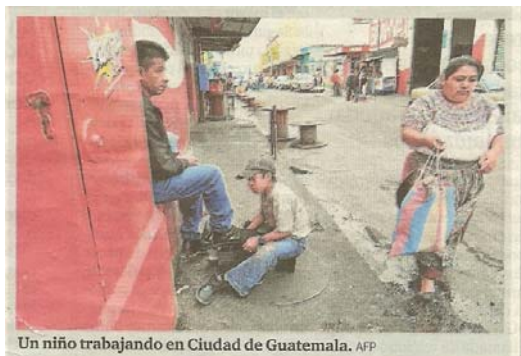
Un niño trabajando en Ciudad de Guatemala.